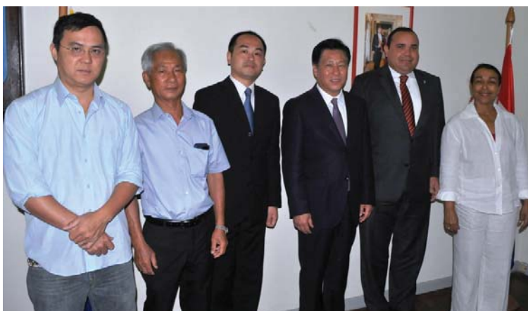
Foto: Gezaghebber en Eilandsecretaris met de delegatie van de Volksrepubliek China